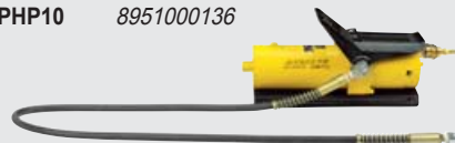
Hydropneumatische pomp. Aanpasbaar met cilinders van HRS04 / HRS10 / HRS20 Zie de beschrijving op pagina 36